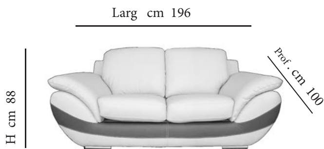
Divano 2 posti - cm 196