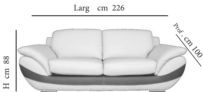
Divano 3 posti - cm 226